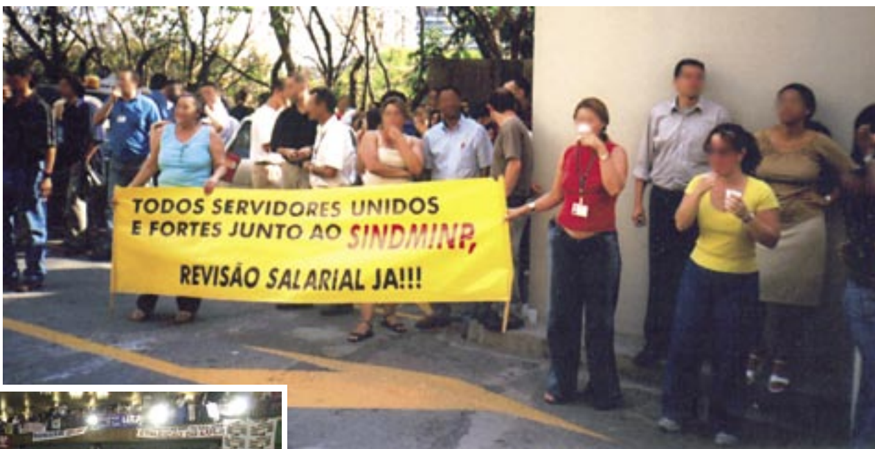
Manifestação de funcionários do MP

entregar-lhe documento relatando nossa situação, em mãos. O relatório foi entregue ainda para lideranças de vários partidos, entre as quais o Senador Suplicy e o Presidente da Câmara, Aldo Rebelo, e também para o presidente da CUT. ATÉ QUANDO AGÜENTAREMOS ESPERAR PELO JUSTO???