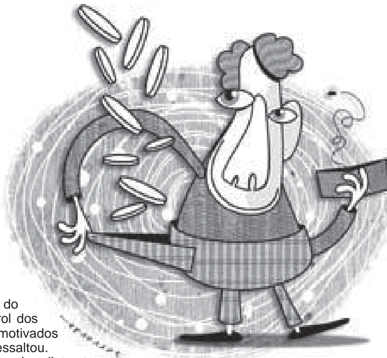
Charge: Gazeta do Sul

Vale lembrar, que o Sindminp está preparando novas turmas para a propositura de novas ações da URV. Para maiores informações, os interessados devem comparecer a sede do Sindicato à Avenida Brigadeiro Luiz Antonio, 54 – 1º andar – conjuntos: B e C – Centro – São Paulo/SP – fone/fax: (11) 3104-1936 – e-mail: sindminp@sindminp.org.br .